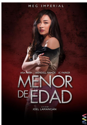
Menor de Edad

Inköpen baseras på revenue share-modell där samtliga innehållsleverantörer får del av försäljningen dels i förhållande till antal visningar samt i förhållande till hur lång filmen är. I vissa fall utgår en s.k. minimumgaranti.