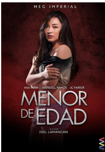
Menor de Edad

Inköpen baseras på revenue share-modell där samtliga innehållsleverantörer får del av försäljningen dels i förhållande till antal visningar samt i förhållande till hur lång filmen är. I vissa fall utgår en s.k. minimumgaranti.