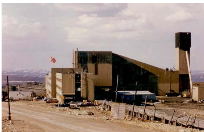
Anrikningsverket i Bidjovagge under produktionen 1985 till 1991. Under 1992 monterades anrikningsverket ned och såldes.

lönsam produktion till och med 1991. I början av 1990-talet föll guldpriserna samtidigt som det skedde strategiska förändringar inom Outokumpu varför bolaget valde att lägga ned verksamheten trots att det fanns redan bruten marginalmalm i lager samt mineraltillgångar kvar i marken.