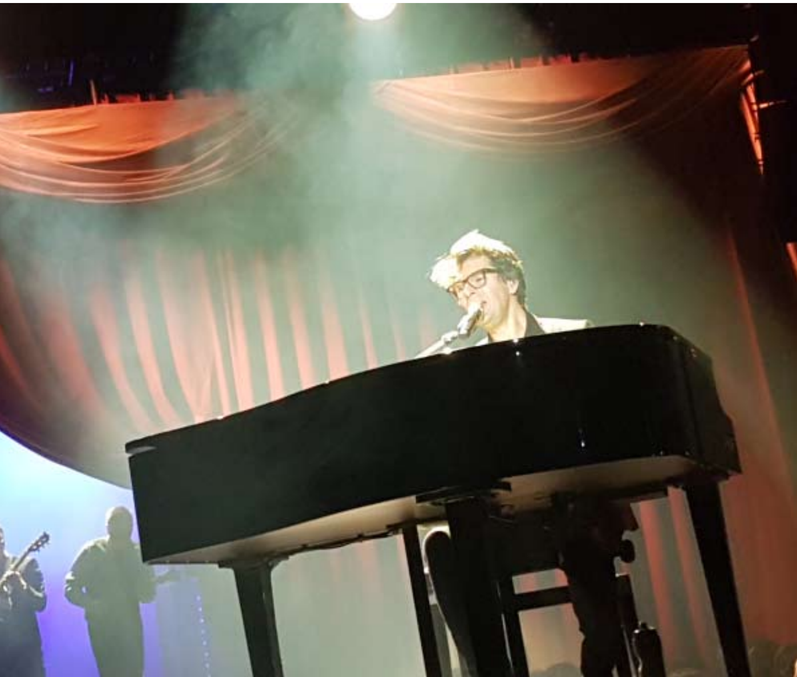
Premiär Niklas Strömstedts show på Trädgår'n i Göteborg