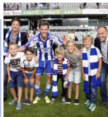
Rasta sponsrar IFK Göteborg