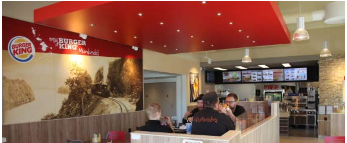
Burger King på Rasta Häby